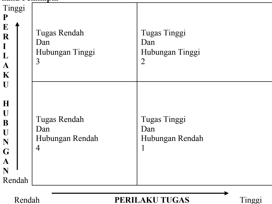
Gambar 1. Gaya Dasar Kepemimpinan

Gambar 1 tersebut menunjukkan hubungan antara seorang pemimpin dengan bawahan bergerak melalui empat tahap seperti siklus sejalan dengan perkembangan dan kematangan ( maturity ) bawahan, dan pimpinan perlu mengubah gaya kepemimpinannya untuk disesuaikan dengan perkembangan setiap tahap. Keempat dasar perilaku yang dimaksud adalah: