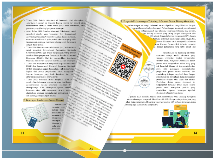
Gambar 3. Animasi Flipbook yang Interaktif

Tidak hanya itu, flipbook juga dapat berfungsi sebagai alat yang mampu mengaitkan antara teori dengan praktik. Penting bagi siswa untuk memahami bagaimana konsep-konsep yang mereka pelajari dapat diaplikasikan dalam dunia nyata. Dengan menyertakan studi kasus dan contoh nyata dalam flipbook, siswa dapat lebih mudah untuk memahami relevansi materi yang diajarkan. Demikian pula dengan penelitian Yusadinata et al. yang menekankan pentingnya pengalaman praktik kerja industri (prakerin) dalam membekali siswa untuk memasuki dunia kerja (Yusadinata et al., 2021). Oleh karena itu, flipbook diharapkan dapat menjadi sarana yang menjadi jembatan yang menghubungkan antara pembelajaran di kelas dengan pengalaman dunia nyata. Selain itu, hasil penelitian ini juga menunjukkan bahwa penggunaan flipbook berpengaruh positif terhadap literasi digital siswa.