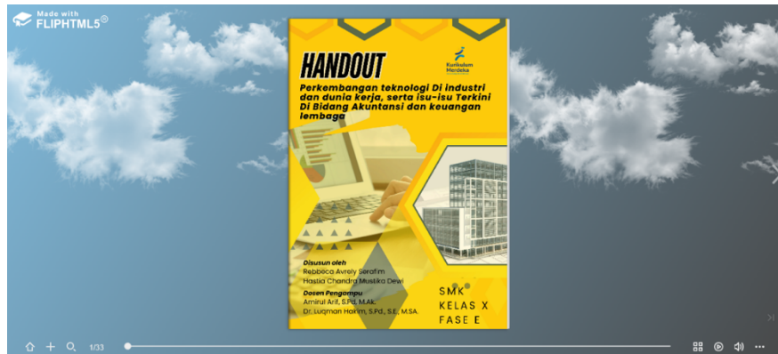
Gambar 1. Tampilan Handout Pembelajaran dengan Media Flipbook

Penerapan flipbook sebagai media pembelajaran dalam proses belajar mengajar di Sekolah Menengah Kejuruan (SMK) Ketintang memberikan pengaruh yang cukup signifikan dalam upaya peningkatan pemahaman siswa terhadap materi yang diajarkan. Kegiatan penelitian ini dilakukan dengan melibatkan siswa jurusan akuntansi dari SMK Ketintang, yang mana flipbook digunakan sebagai media pembelajaran interaktif. Berdasarkan hasil analisis diketahui bahwa siswa yang menggunakan flipbook mempunyai pemahaman yang lebih baik terhadap konsep-konsep akuntansi jika dibandingkan dengan siswa yang pembelajarannya menggunakan metode konvensional. Temuan ini sejalan dengan penelitian oleh Nuryani dan Abadi yang mencatat bahwa media pembelajaran flipbook dapat membantu meningkatkan keterampilan berpikir kreatif siswa, hal yang sangat dibutuhkan pada bidang akuntansi dimana siswa sering kali membutuhkan analisis dan pemecahan masalah.