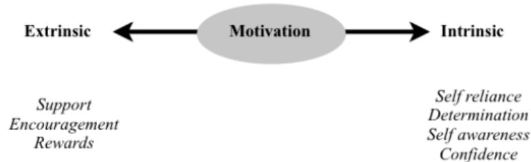
Gambar 1. Tipe motivasi (Mubeen & Reid, 2006)

& Reid, 2006). Bahkan Herter dan Jackson (dalam Mubeen & Reid, 2006) menyatakan bahwa motivasi ekstrinsik tidak hanya digunakan dalam pembelajaran di kelas melainkan juga di masyarakat dalam bentuk hadiah, penghargaan masyarakat, dan honor. Kedua jenis motivasi dapat digambarkan sebagai berikut: