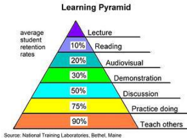
Gambar 1. Piramida Cara Belajar Beserta Persentase Daya Serap

Siswa yang mengomunikasikan hasil pemikirannya kepada orang lain tidak lagi menjadi obyek yang pasif, yang hanya mendengarkan penjelasan dan mengikuti perintah-perintah dari guru. Berdasar hasil kajian National Training Laboratories Bethel, Maine ( www.ntl.org ), belajar dengan menjelaskan kepada orang lain ( teach others ) dapat menyerap materi sebanyak 90% dibandingkan cara belajar yang lain sebagaimana terlihat pada Learning Pyramid berikut.